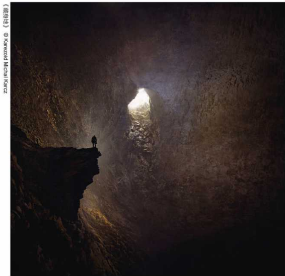
【洞穴】 © Kazerozi Michal Karz