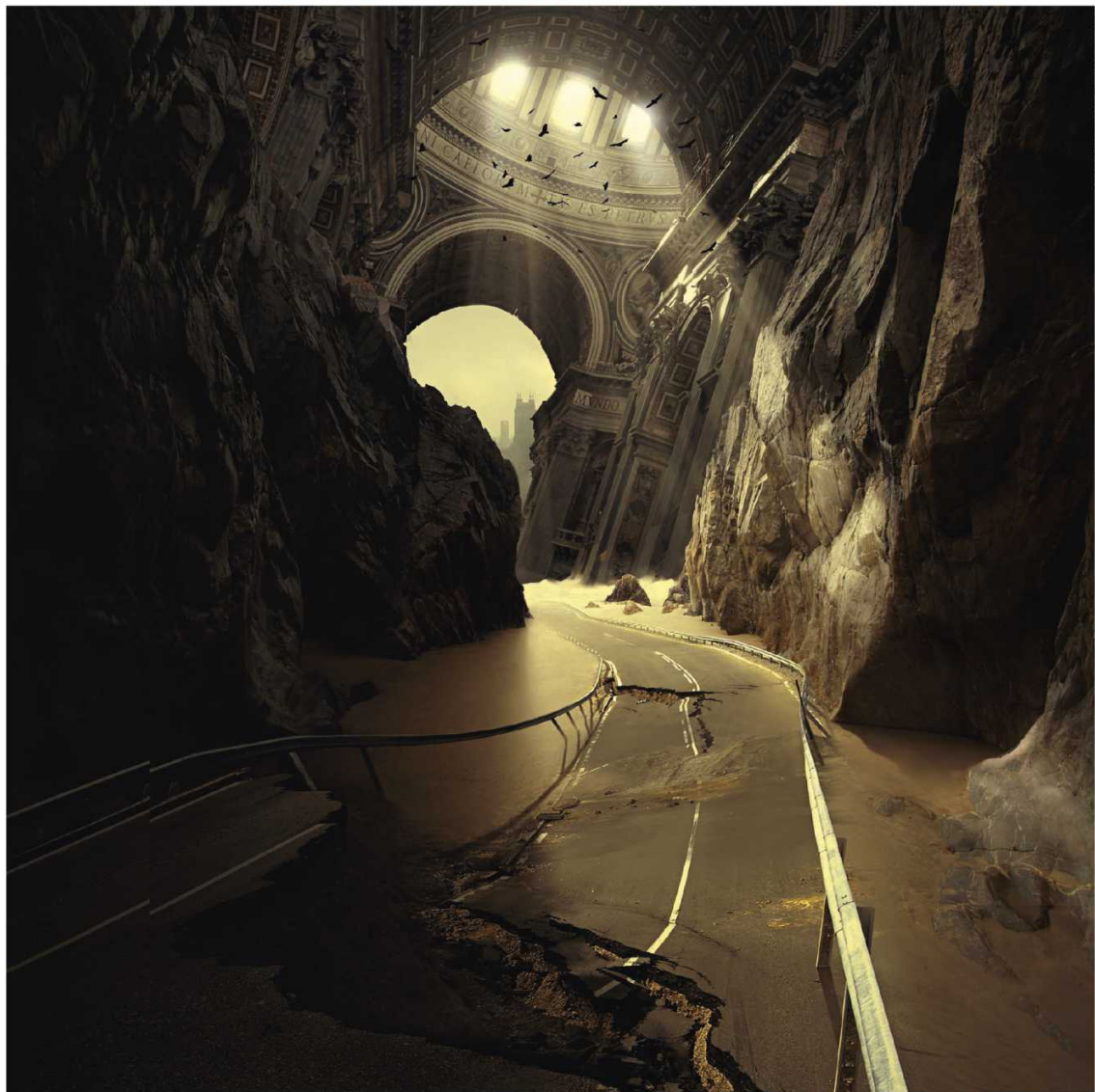
【神秘空间】

Michal：如果有读者通过我的图片产生了这样的思考，我感到荣幸，那都是我的思想最直观地反映。看来，我实现了自己的目标：提供信息、激发思考，而不是仅仅呈现静态的图片。