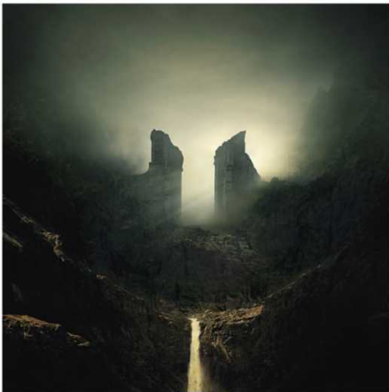
《莫里亚》 © Karezoid Michal Karcz