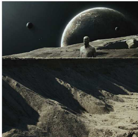
《超越者》 © Karezoid Michal Karcz