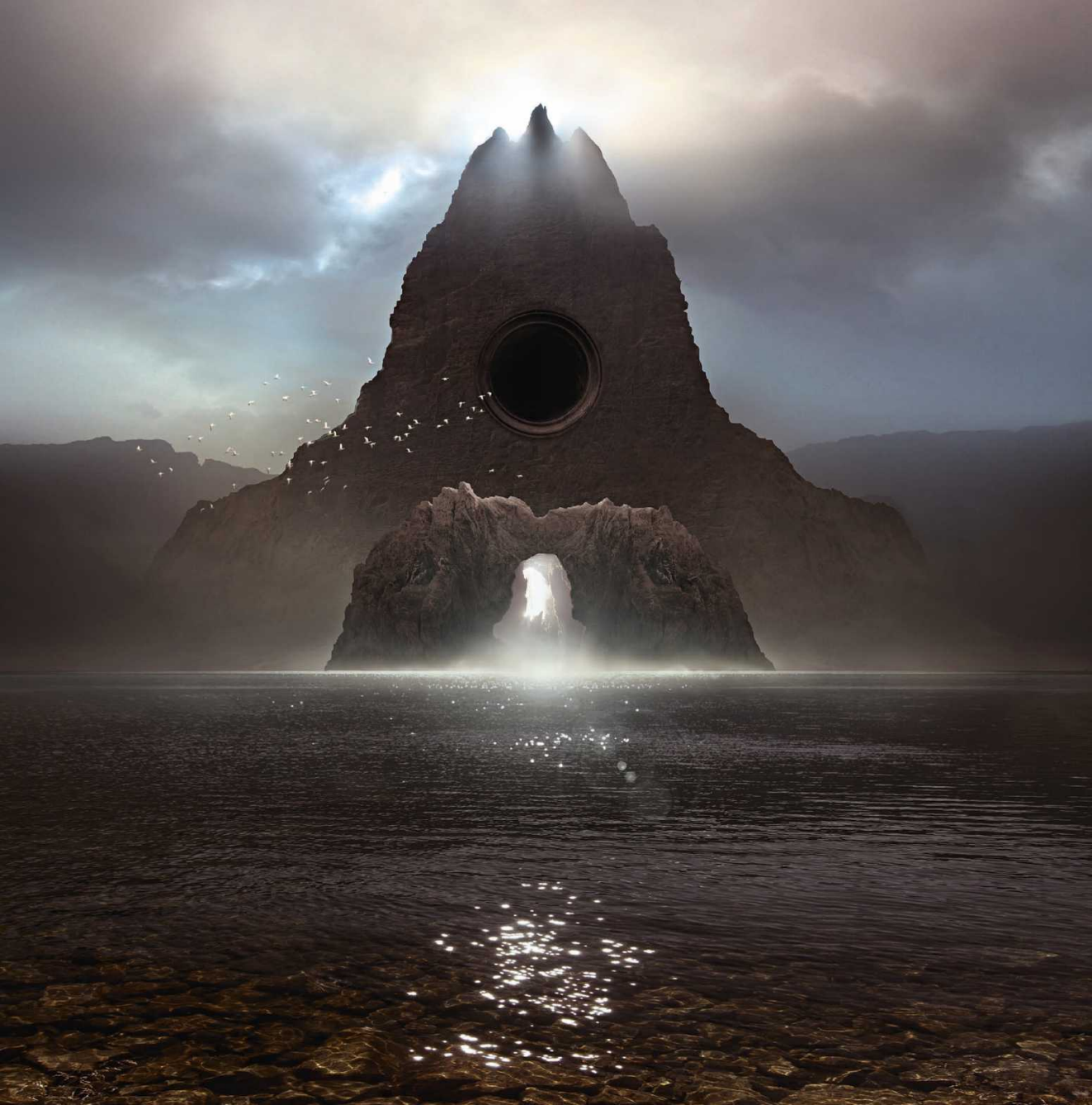
《5thHyperportal》 © Karelod Michal Karca